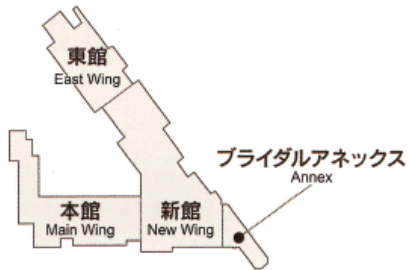
明治記念館全館レイアウト Meiji Kinenkan Layout Map